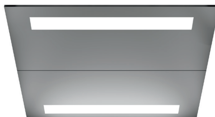
Panneaux lumineux DEL rectangulaires (CL94)** Acier Inoxydable Brossé (4SS)