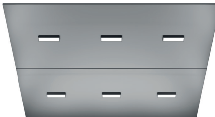
Luminaire DEL rectangulaires (CL98)* Acier Inoxydable Brossé (4SS)

* 6 luminaires dans les ascenseurs pour passagers; 9 luminaires dans les ascenseurs de service