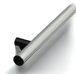
Ronde, extrémités droites (HR50) Aluminium Anodisé (AL)