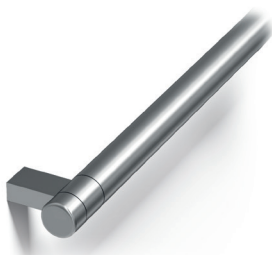
Ronde, extrémités droites (HR61) Acier Inoxydable Brossé (4SS)