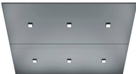
Luminaire DEL carrés (CL97)* Acier Inoxydable Brossé (4SS)