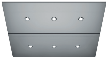
Luminaire DEL ronds (CL88)* Acier Inoxydable Brossé (4SS)