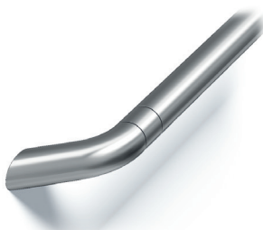
Ronde, extrémités coudées (HR64) Acier Inoxydable Brossé (4SS)